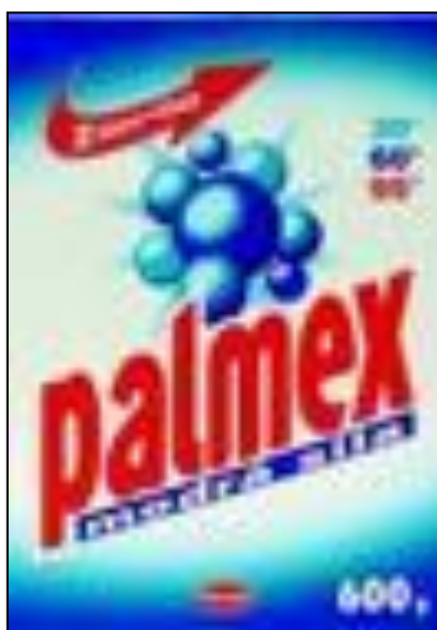
Obr. 1: Palmex modrá síla

Největší prodej se předpokládá u pracího prášku Palmex modrá síla, který bude v 1. pololetí 2008 novinkou, kterou firma uvede na trh. Z tohoto důvodu byla zahájena velká reklamní kampaň, aby se tento produkt dostal do povědomí zákazníků.